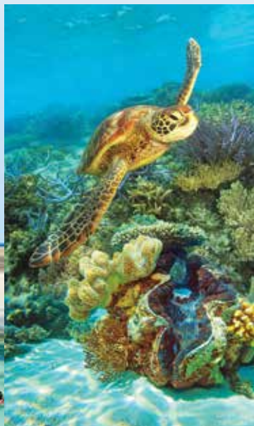
在绿岛周边浮潜时，与海龟和热带鱼儿面对面亲密接触。

从空中俯瞰绿岛的感觉简直是难以置信的。探索凉爽的热带雨林，黄斑秧鸡在雨林地面闲逛，蝴蝶则在热带天空中翩翩起舞。绿岛上生活着超过120种以上的植物，以及50多种鸟类，所以这里有很多值得一看。