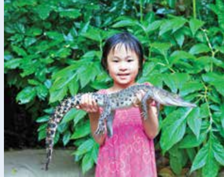
Marineland Melanesia 海洋生态馆为海洋生物爱好者提供独特的体验。

无论是浮潜，潜水，海底漫步，玻璃底船或半潜水艇之旅，绿岛为您提供丰富多彩的探索大堡礁各种方式。